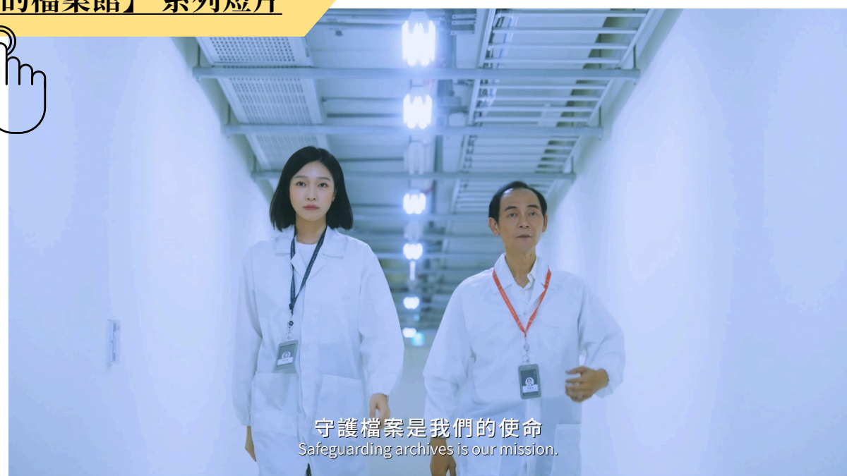
守護檔案是我們的使命 Safeguarding archives is our mission.