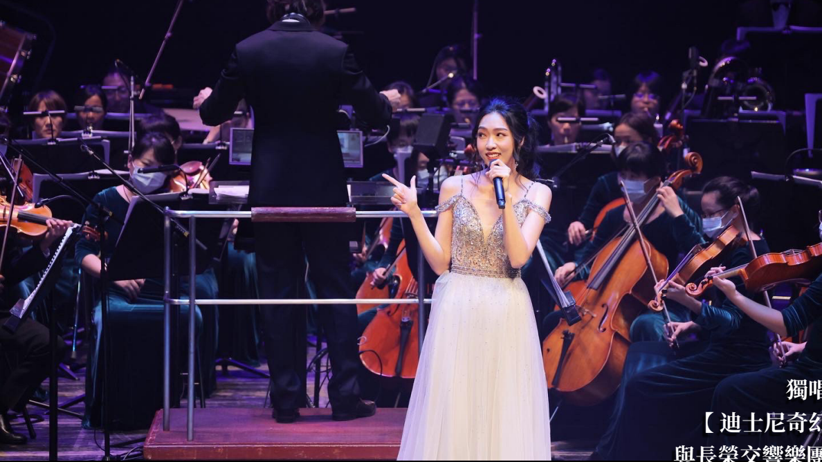
獨唱歌手 【迪士尼奇幻交響音樂會】 與長榮交響樂團台灣巡迴(2022)