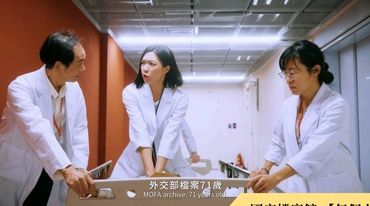
外交部檔案71歲 MOFA archive. 71 years old.