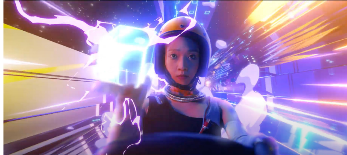
ViewSonic 品牌形象廣告 (2022)