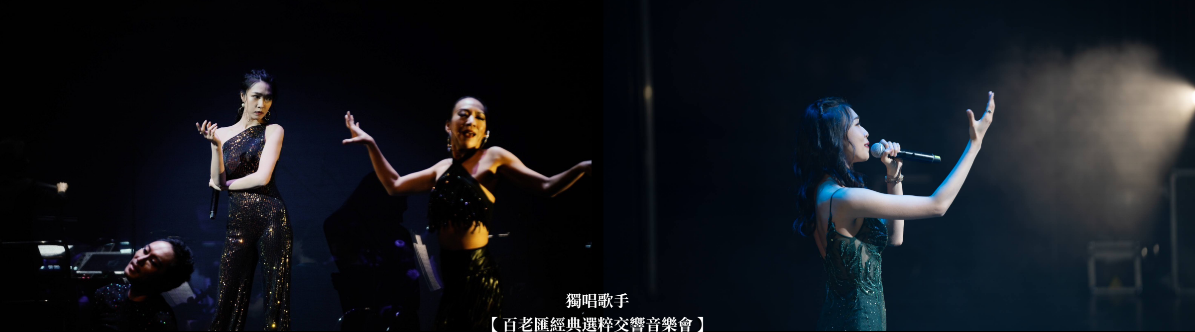
獨唱歌手 【百老匯經典選粹交響音樂會】 與長榮交響樂團台灣巡迴(2023)